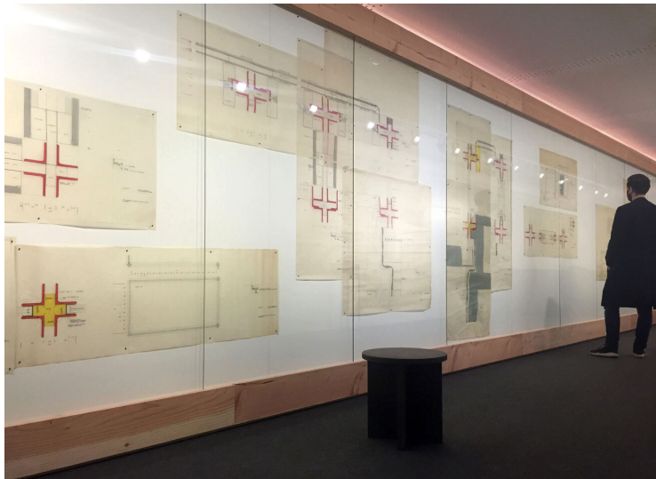
Unfolding the Archives#2 Juliaan Lampens

Elk project van Lampens heeft een gemeenschappelijke insteek: het is verlost van harde grenzen; programma's lopen in elkaar over; binnen loopt door naar buiten en de tuin vloeit over in het landschap. Deze overgangen ogen door Lampens detailleringen subtiel en glashelder. Muren die van binnen naar buiten in hetzelfde materiaal doorlopen verschillen onderling van elkaar doordat het materiaal buiten onderhevig is aan de elementen van de natuur. Materialen verweren in de buitenlucht. Hout verbleekt en het beton verkleurt langzaam naar groen.