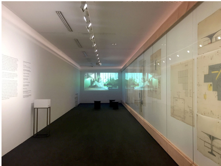
Unfolding the Archives#2 Juliaan Lampens / foto de auteur

De sculpturale kwaliteiten van Juliaan Lampens' werk blijven architecten zowel binnen als buiten België fascineren. In 1991 organiseerde het Vlaamse Architectuurinstituut al eens een tentoonstelling met en over Lampens. De bij behoorde catalogus, samengesteld door Lampens zelf, is onlangs opnieuw door het Vai uitgegeven. Tevens is er een kleine tentoonstelling waarin een niet uitgevoerd werk, een toeristen onthaalcentrum, te bewonderen is.