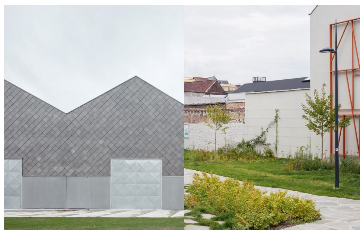
Links: Basisschool De Linde in Zarren van FELT architecture & design / Rechts: Standaertsite Gent van ea/Carton123 en murmuur architecten